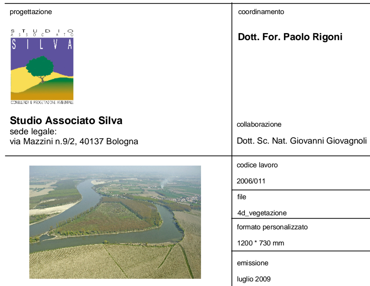
Tav. 4d - Carta della vegetazione scala 1:10.000