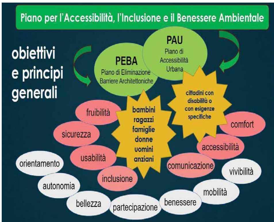
Fig. 1 – Obiettivi e principi

Linee guida di Regione Lombardia per la redazione dei PEBA